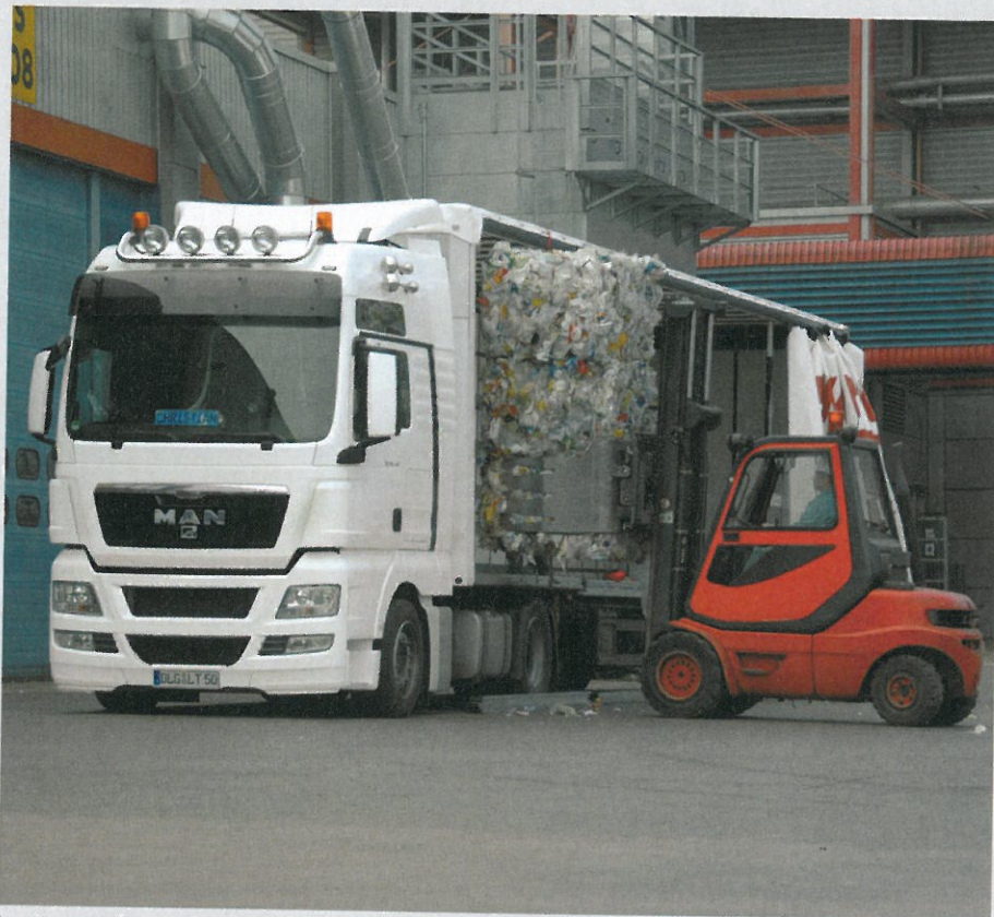
Los transportistas gallegos quieren acabar con la competencia desleal en el sector.

Establecer un marco de competencia leal en el mercado del transporte y proteger al porteador efectivo son las premisas que establece la federación gallega para reclamar un sector eficaz y justo. Los transportistas están a la espera del resultado final del texto legal.